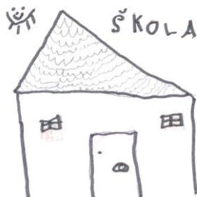
Agáta Suková 2. ročník