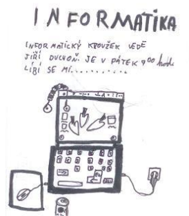
Bořivoj Hadač 5. Ročník